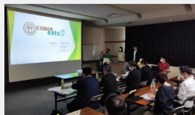
R4デジタル人材育成講座発表会の様子