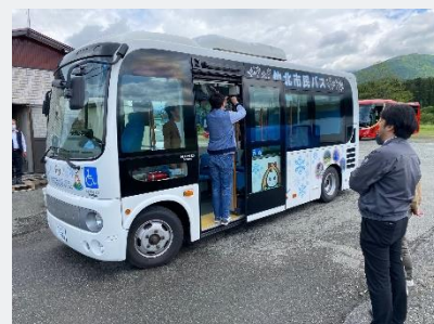
AIカメラ等設置準備の様子