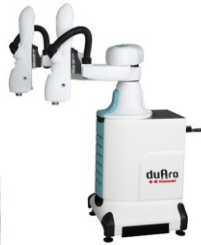
「duAro」川崎重工業製 人共存型 吸着ハンド付