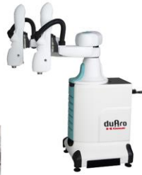
「duAro」川崎重工業製 人共存型 吸着ハンド付