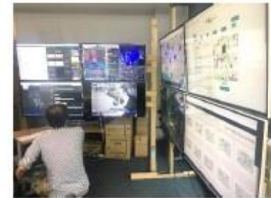
湘南地域の環境データ活用実証 を踏まえたセンシング製品