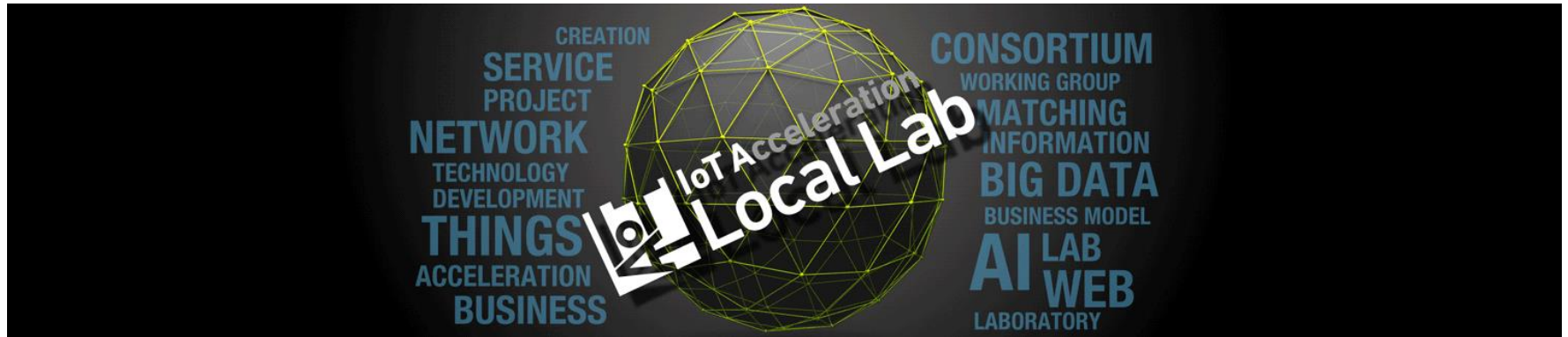
IoT Acceleration Shihoro town Lab