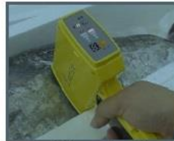
気仙沼の漁協での実証を踏まえた タラの雌雄自動判定装置