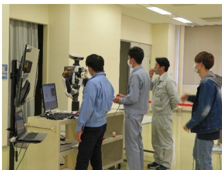
デモ・ロボットによるシュミレーション