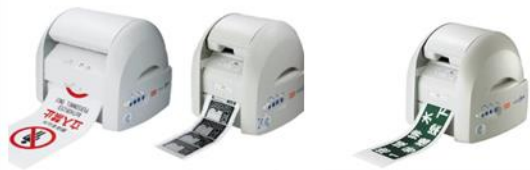
フリーカット ラベルプリンタ