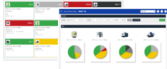
新明和ソフトテクノロジー（株）

工作機械やPLC（制御装置）などの工場設備や、RFIDを用いた人の動きなど、工場内の稼働状況をリアルタイムで監視し、データ収集する製造工場向けのIoTシステムです。生産設備の動作データを収集し、解析・可視化することによって運転状況や異常検知等の情報を把握することが可能となります。