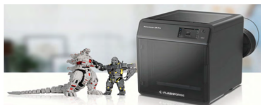
快適で安全な3Dプリント体験「Adventurer5M Pro」

RICOH Rapid Fabは 品川、大阪、名古屋、福岡の3Dプリンターのショールームです。数台の実機と、様々なメーカー、方式の造形サンプルをご用意しています。また、設計、製造の現場で長年3Dプリンターを活用してきたリコーの技術者が、お客様のあらゆるご相談にお応えします。