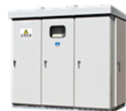
高圧機器の更新推奨時期 15年～20年

保守点検で書かれた指摘事項や内容がさっぱりわからない？ PCBの廃棄処理期限に対し、どうすればよいかわからない？ 「再生電力」「Co 2 削減」 「省エネ機器」だけでなく、 キュービクル等の高圧受電設備等の 更新電気工事をご提案可能です。