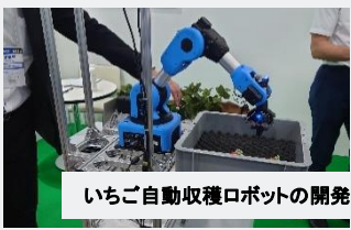
いちご自動収穫ロボットの開発