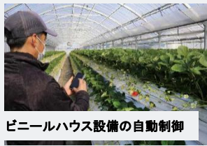
ビニールハウス設備の自動制御

総務省 地域デジタル基盤活用推進事業 「Wi-Fi HaLow、Wi-Fi6Eを活用したIoT/AIによる農作業自動化システムの構築実証」