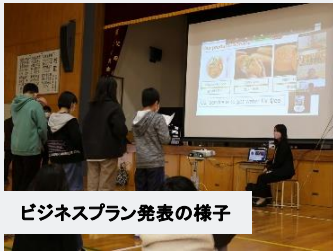
ビジネスプラン発表の様子

初等教育課程から子どもたちの社会や組織を変革する能力を育成するため、市内の小学校でアントレプレナーシップ教育を行っています。