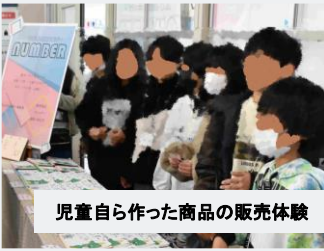
児童自ら作った商品の販売体験